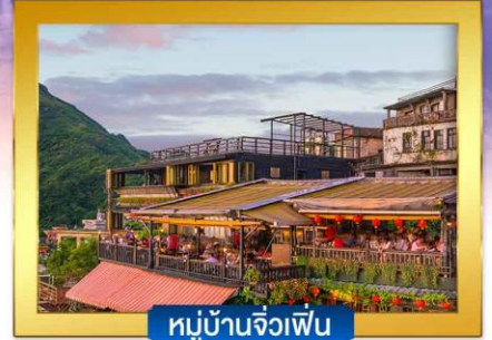
หมู่บ้านจิวเฟิ่น

พิเศษ !! บุฟเฟ่ต์ชาบูไต้หวัน , ปลาประธาราธิบดี, เสี่ยวหลงเปา , ไอศกรีม MIYAHARA