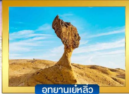
อุทยานเย้หลิว